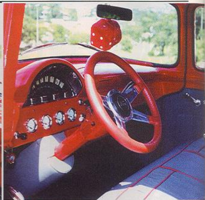
O banco inteiriço, revestido em couro cinza. O volante, que veio dos Estados Unidos, é da marca Lecarra.

década de 50 e apresenta o logotipo Ford estampado em alto relevo, seguindo, portanto, as especificações da tampa original.